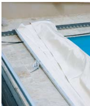
POSE DE LA BÂCHE SUR LA STRUCTURE.