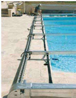
STRUCTURE SUR LA PISCINE.