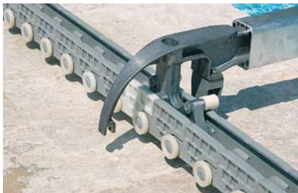
FIXATION DES ARCEAUX SUR LA CHAÎNE.