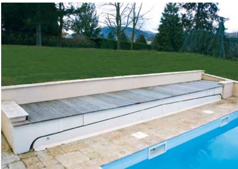
COFFRE FERMÉ PAR UN CAILLEBOTIS.