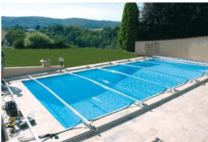
STRUCTURE PRÊTE À FONCTIONNER.