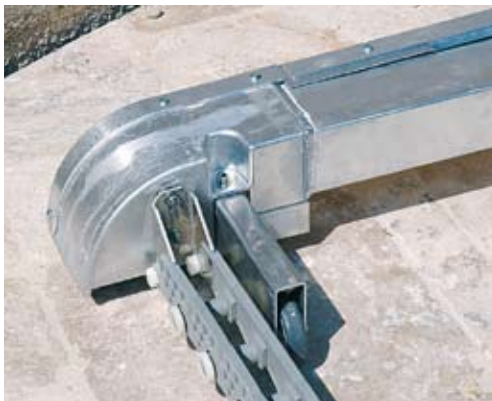
L'AVANT DE LA COUVERTURE.