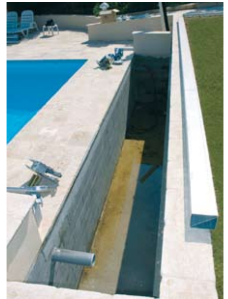
COFFRE AVANT MONTAGE DE PRIMA.