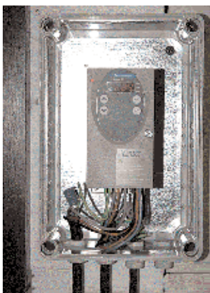
LE COFFRET ÉLECTRONIQUE.