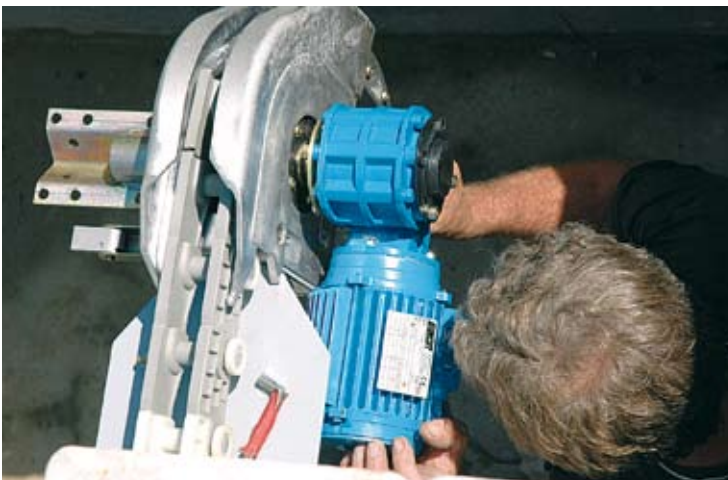
POSE DES ACCESSOIRES DANS LE COFFRE.