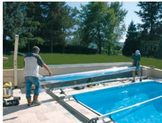
MISE EN PLACE DE LA TRANSMISSION.