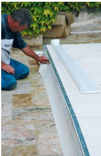
FIXATION DE LA BAVETTE À L'AVANT POUR L'ÉTANCHÉITÉ.