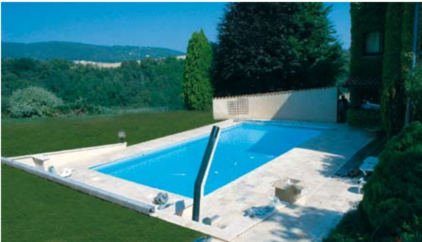
PISCINE À COUVRIR.