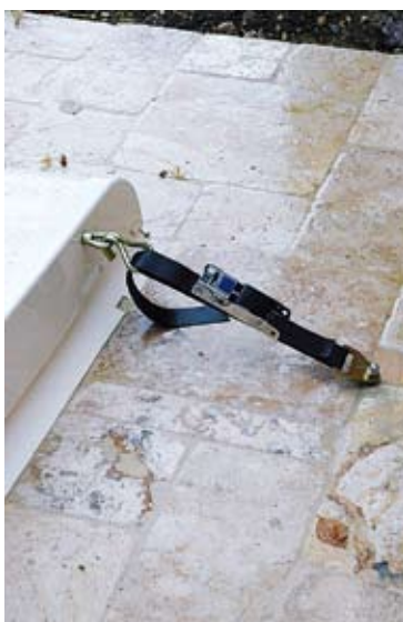
SANGLE DE POUTRE AVANT.