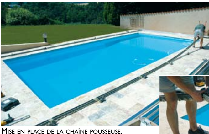
MISE EN PLACE DE LA CHAÎNE POUSSEUSE.